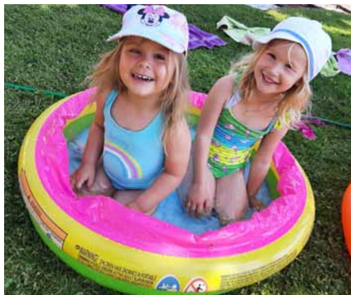
... ein bisschen Plantschen

„Seppl allein zu Hause“ hieß das Stück. Die Kinder waren voller Begeisterung und mit Anspannung dabei.