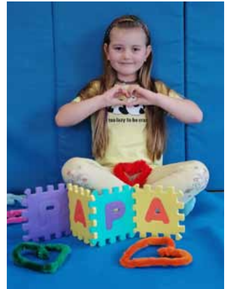
Vattertag steht vor der Tür...

Mittlerweile konnten wir auch den Sommer begrüßen. Die Kinder haben eine Menge Spaß und Freude daran, im Garten mit Wasser zu spielen, experimentieren, forschen und natürlich zu plantschen.