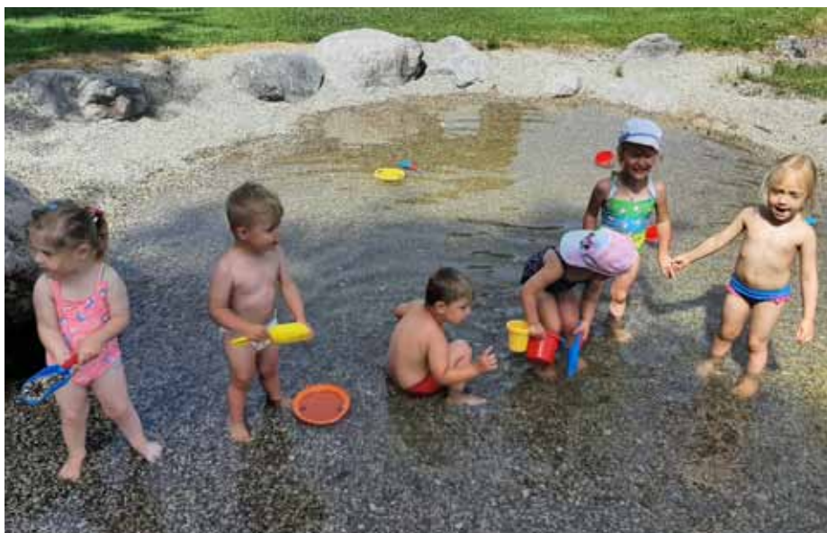
Eine herrliche Abkühlung