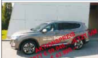
HYUNDAI SantaFe "Level 5"

Bj: 01 / 2020 Ausstattung: Antrieb: Diesel "Level 5"-Ausführung, 4WD Km: 500 19"Alu, 8G-Autom, Standheiz KW/PS: 147 / 200 5-Sitze, VOLLAUSSTATTUNG