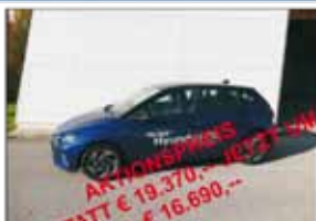
HYUNDAI i20 "i-Line +"

Bj: 01 / 2020 Ausstattung: Antrieb: Diesel "Level 5"-Ausführung, 4WD Km: 500 19"Alu, 8G-Autom, Standheiz KW/PS: 147 / 200 5-Sitze, VOLLAUSSTATTUNG