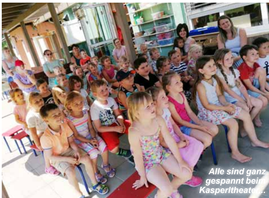
Alle sind ganz gespannt beim Kasperltheater...

Mit der Methode „Kasperltheater“ schaffen es Kasperl, Seppi und seine Freunde, gesundheitliche Aspekte kindgerecht zu vermitteln. Dabei werden die kleinen Zuschauer aufgefordert, aktiv am Geschehen teil zu nehmen.