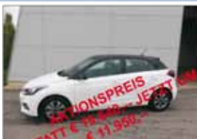
HYUNDAI i20 "Level 3+"

Bj: 11 / 2020 Ausstattung: Antrieb: Benzin "i-Line"-Ausführung Km: 6 500 16"Alu, 5G-manuell KW/PS: 62 / 84 VIELE EXTRAS!!!