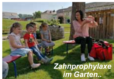
Zahnprophylaxe im Garten..

Für Kindergarten und Kinderkrippe Elisabeth Kutschi