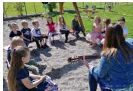
Singen im Garten