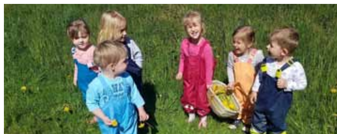
Wir sammeln Löwenzahnblüten für einen Löwenzahnhonig.