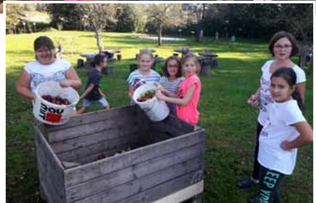
Äpfel sammeln am Loamtrattl

beschneigungsanlagen abfallentsorgung oberflächenentwässerung gutachten