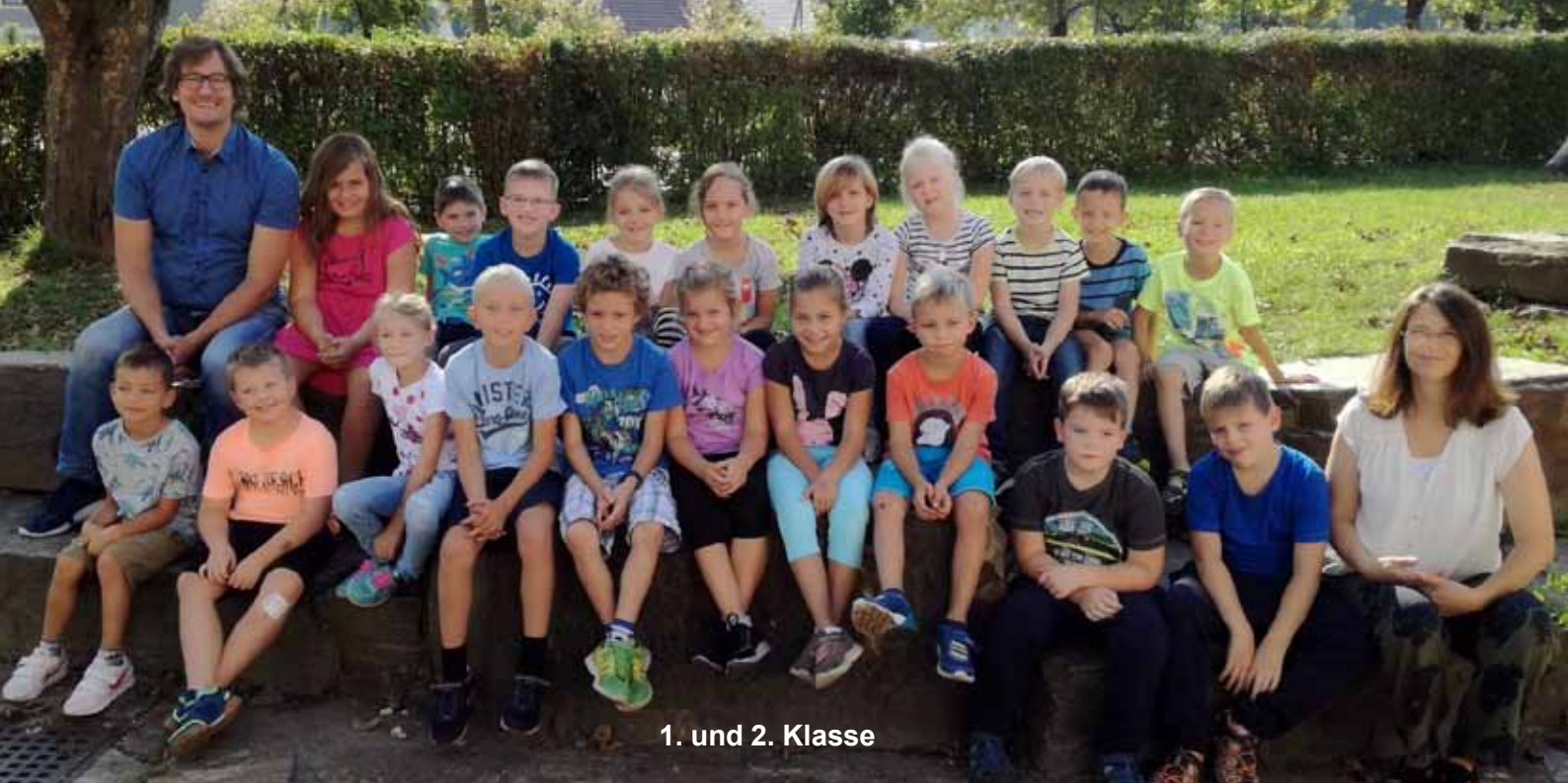
1. und 2. Klasse