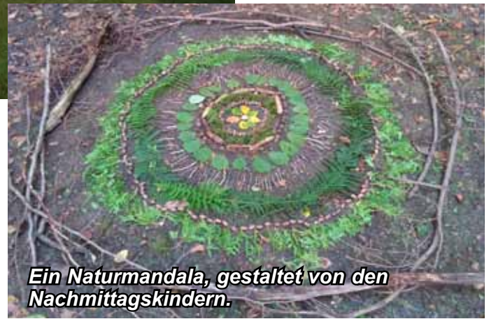
Ein Naturmandala, gestaltet von den Nachmittagskindern.